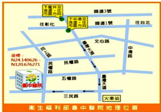
衛生福利部臺中醫院地理位置